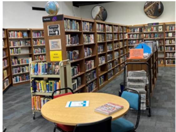
[그림 4] 워싱턴 여성교정센터와 도서관 전경