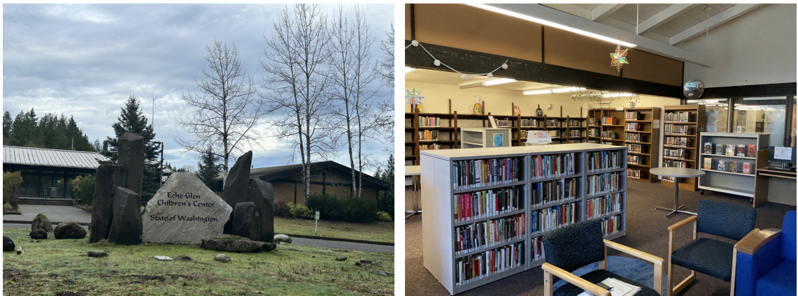
[그림 3] 에코글렌 아동센터와 도서관 전경

독후활동 결과물을 도서관 내에 전시하여 주인의식을 가질 수 있게 해주고 란튼 기술 대학(Renton Technical College)과 연계하여 청소년 교과수업에 필요한 자료를 지원해준다. 비영리단체와 협력하여 작가 섭외와 여름 독서교실, 소설 쓰기, 시 워크숍 등의 프로그램을 운영하고 있다.