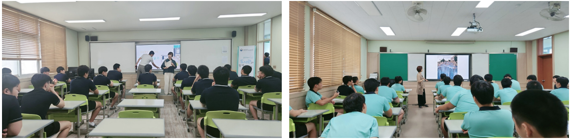
[그림 2] 2024년도 독서문화프로그램 운영 현장

카테고리를 정하고 청소년 자존감 회복, 자기 이해, 대인관계, 진로 고민, 정신건강 등의 내용을 담을 수 있도록 체계적으로 구성하였다. [그림 2]는 2024년도에 실시한 독서문화프로그램의 현장을 담은 것이다.